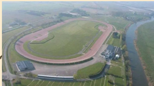
Etape 2 : Arrêt 1 (1h30) Hippodrome de l'Anse de Moidrey