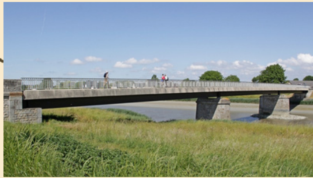
Etape 3 : Arrêt 2 (20 minutes) Pont de Beauvoir