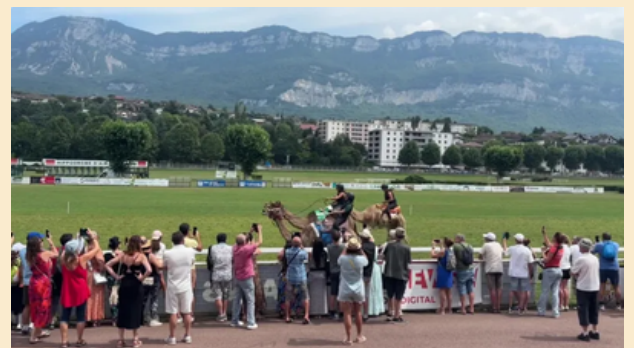
Le 4 août n'était pas un dimanche de course comme les autres sur l'hippodrome d'Aix-les-Bains (Savoie). Ce ne sont pas des courses de chevaux, mais de dromadaires que sont venus suivre près de 3000 spectateurs.

Evènement exceptionnel qui a réuni des jockeys français et internationaux pour deux courses internationales de dromadaires, offrant une expérience unique et captivante aux spectateurs.