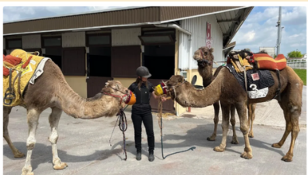
Une journée dédiée à la Mauritanie, avec des courses de dromadaires, est prévue le samedi 15 juin 2024 à l'hippodrome de Reims.