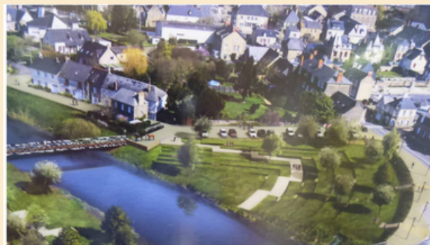
Etape 1 : Départ Etape 4 : Arrivée Amphithéâtre de Pontorson