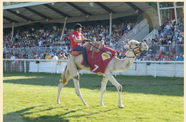
04/06/2024 à l'hippodrome d'Aix-les-Bains (Savoie)

Evènement exceptionnel qui a réuni des jockeys français et internationaux pour deux courses internationales de dromadaires, offrant une expérience unique et captivante aux spectateurs.